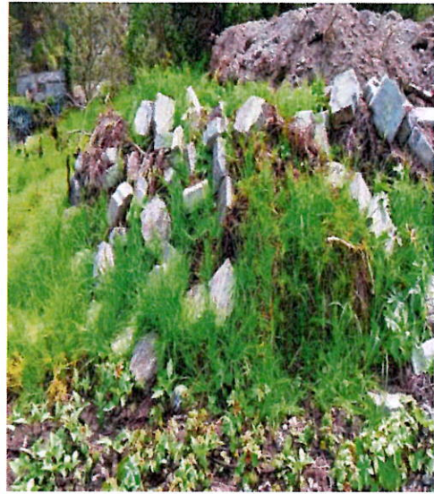
Situación actual de la infraestructura del coliseo